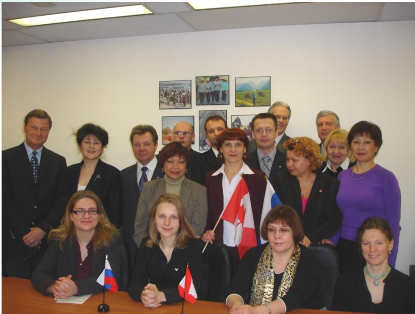
Стажировка в Канаде, 2006